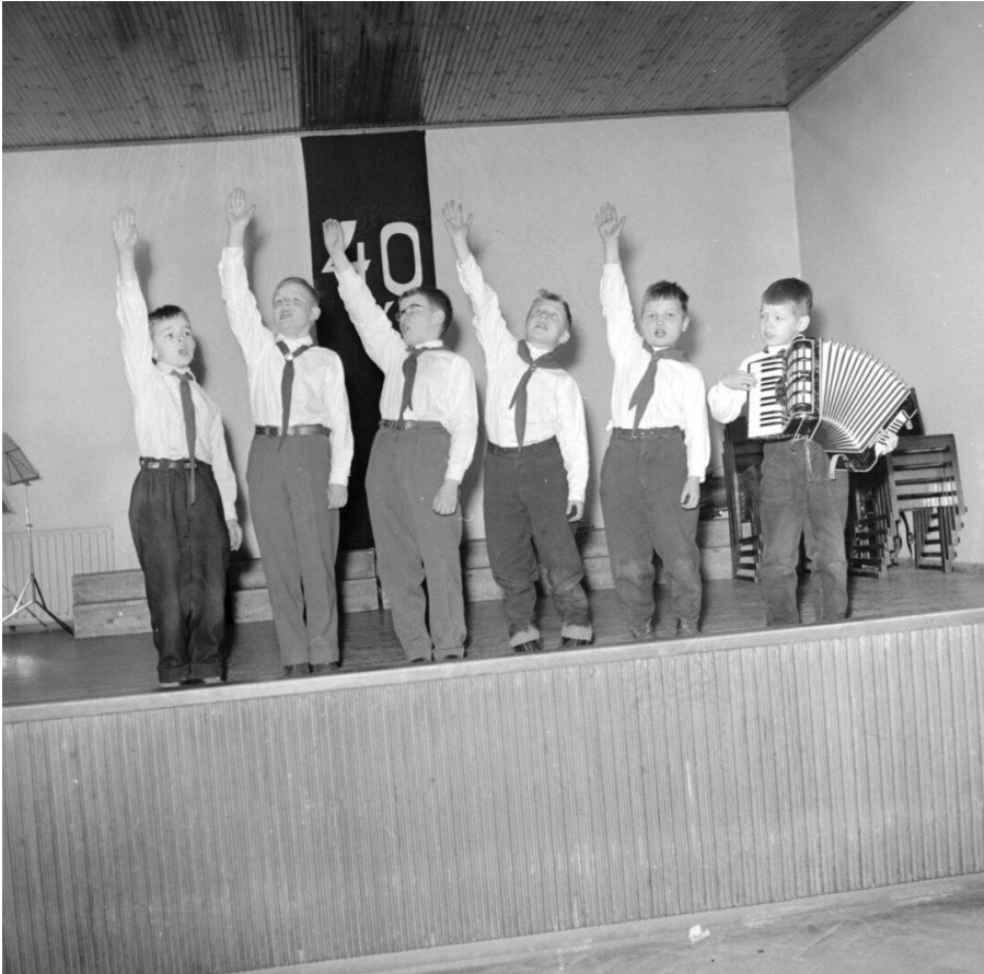
Tässä taustatekstistä päätellen Pispalan kisällit talvella 57-58. Liikkeestä päätellen lauletaan, jahka kasvetaan suureksi.