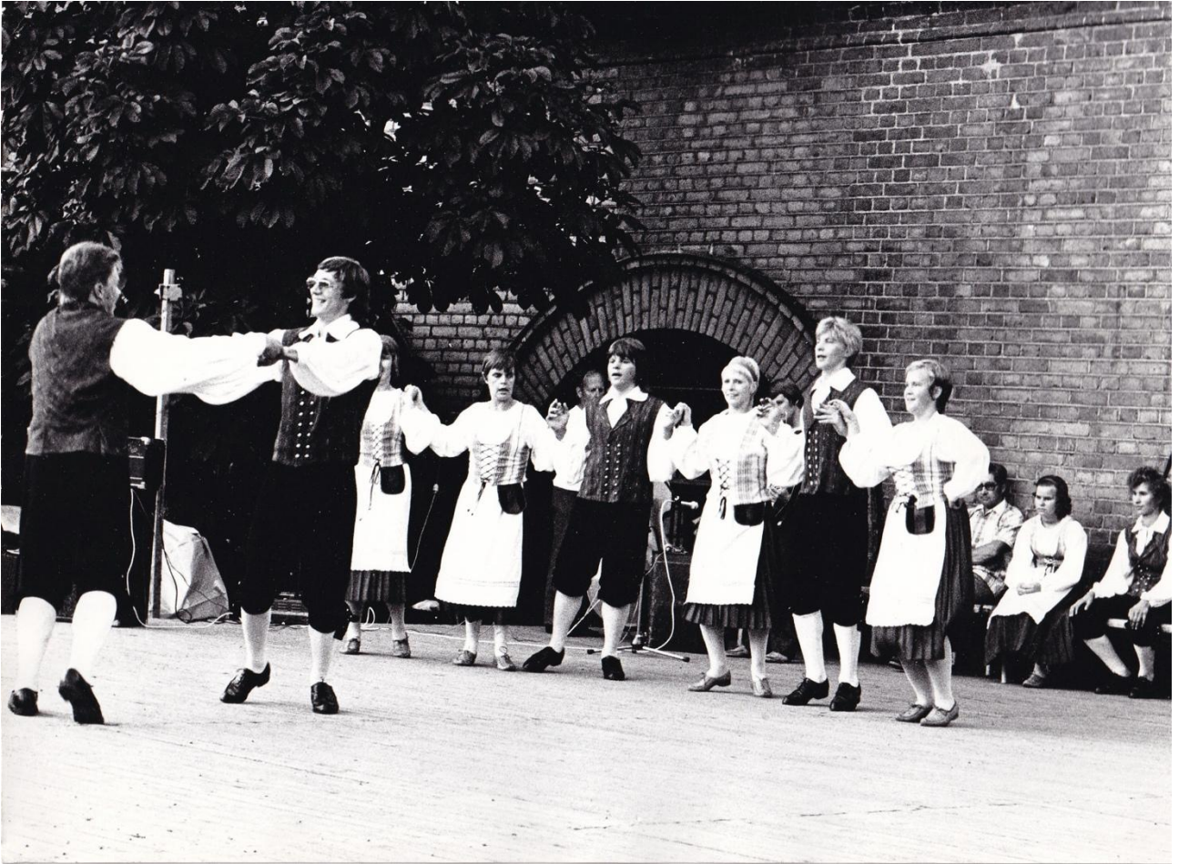
Kesäisin esiinnyttiin kaupungin puistotankuissa Kirjastotalon puistossa. Tunnin ohjelmasta sai korvausta talven toimintaa varten.