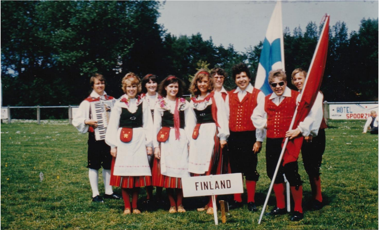
Hollannin kansantanssifestivaaleilla -74