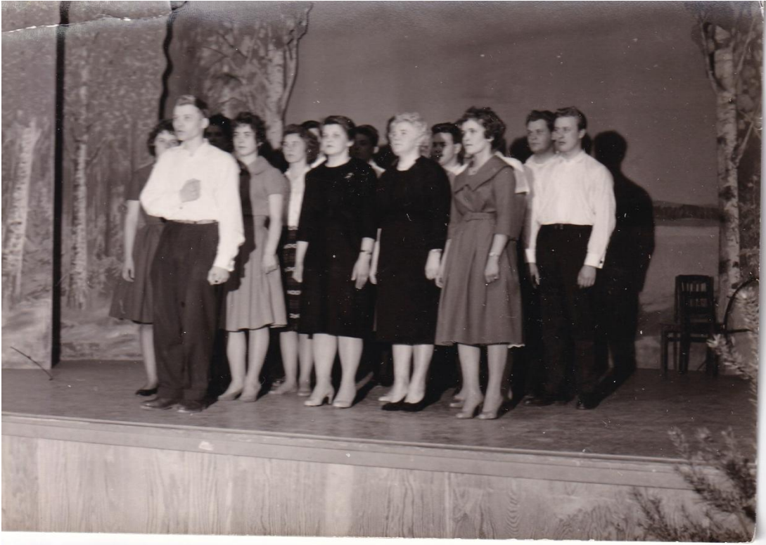
Joukkolausuntaa Messukylän työväentalolla v. 1960