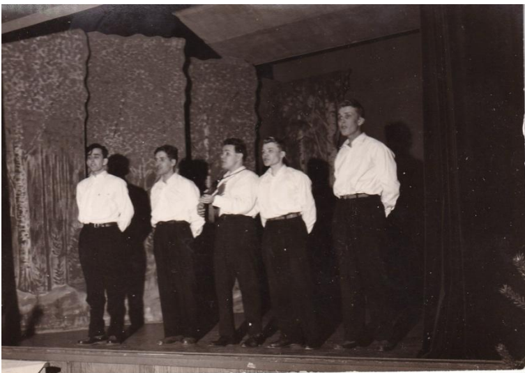
Messukylän kisällit osaston 15-vuotisjuhlissa 1960