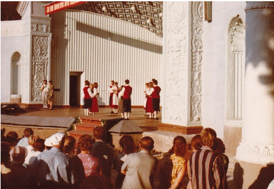
Kievin kansanpuiston esiintyminen.

Mieleenpainuvimpia esiintymisiä oli Kievin kansanpuistossa 1969, Minskin oopperatalon lavalla Berliinin Festivaalimatkan yhteydessä ja ennen kaikkea Osallistuminen Warffumin kansantanssifestivaaleille Hollannissa 1974.