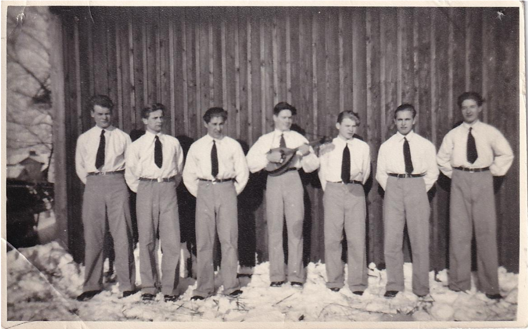
Messuveikot helmikuussa 1950